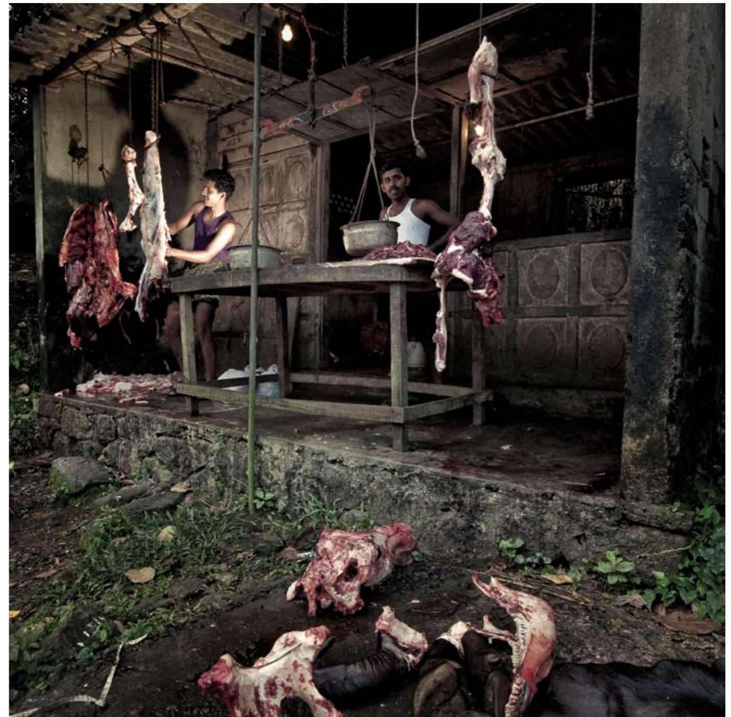
Je zou het niet zeggen bij het bekijken van deze Indiaase openluchtslagerij. Een van de laatste en meest bevreemdende foto's van PortraitsOfAsia. Het was nog vroeg in de ochtend, toen dit tafereel zich aan mijn netvlies (en mijn nuchtere maag) aanbood. Eén van de ontelbare momenten dat je je als fietsende fotograaf afvraagt of je stopt of doorrijd. Ik deed 'the right thing' en stopte. Ik klauterde een kleine helling op en zag pas toen dat het grasperk voor de slagerij bezaaid lag met stoffelijke resten van dieren. Ik haalde de breedhoek tevoorschijn, omdat ik zowel deze voorgrond als de slagerij zelf in beeld wilde brengen.

"Nu ik weer terug ben moet ik alles wat bleef liggen terug gaan oppakken. Om te beginnen wil ik het cursusaanbod met Lightroom verder uitbreiden. Dit is duidelijk een applicatie die meer nog dan Photoshop gericht is op de pure fotograaf,