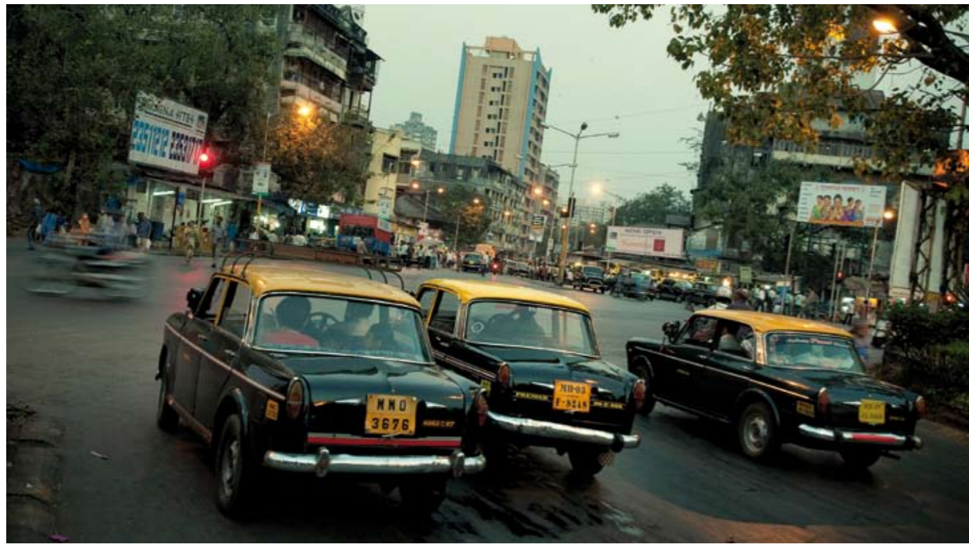
Een van de eerste dingen die opvallen bij een bezoek aan Mumbai zijn de charmante oude taxi's. Ze hebben iets van een oversized speelgoedautootje (en ze voelen ook zo aan wanneer je je één meter drieënnegentig op de achterbank probeert kwijt te raken). Er rijden er zo'n 40.000 rond in Mumbai, in verschillende staten van mechanische ontbinding. Niet alleen de 'mansions' zijn 'gently crumbling'.

Er is zo weinig plaats in de taxi's, dat de meter aan de buitenkant zit. Niet dat je als toerist veel van die meter merkt: je wordt getaxeerd op je kleren, je boodschappentassen, je camera en de mate van vastberadenheid cq wanhoop die je uitstraalt. Op basis daarvan wordt – à la tête du client – een vaste prijs voorgesteld. Voor je 't weet ben je gerold, nog voor je gereden bent.