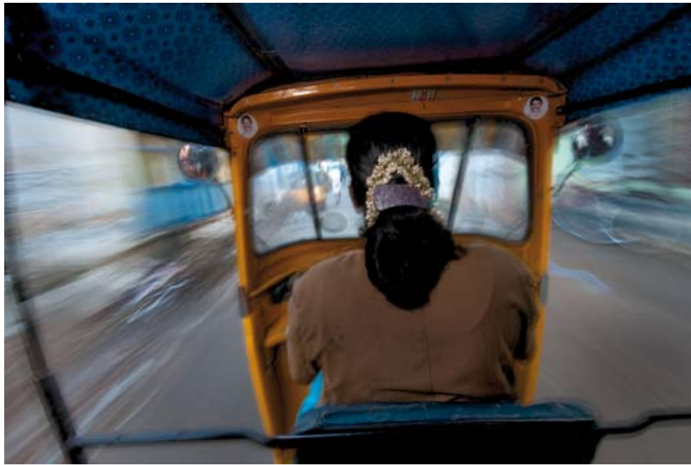
Rickshaws zijn in India een heel courant transportmiddel. Voor de Westerling die zich normaal verplaatst in een airconditioned, rondomron van airbags voorziene vierwieler, zijn deze gemotoriseerde driewielers een kruising tussen een spannende kermisattractie en een zenuwslopende dodenrit. Denk Disneyland maar dan zonder de veiligheidsvoorschriften. 99% van de rickshaw-chauffeurs zijn mannen, maar in Thanjavur in Zuid-India vonden we dit vrouwelijk exemplaar. Van op de kleine ronde foto's in de uithoeken boven het windscherm houdt manlief een oogje in het zeil.